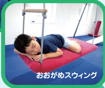
おおがめスウィング